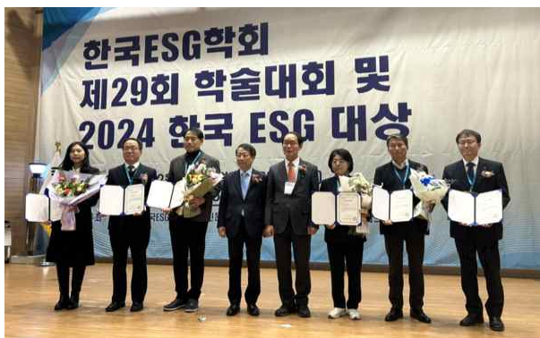
(재)경북여성정책개발원 공공기관 부문 대상

한국ESG학회 제29회 학술대회 및 2024 한국ESG대상 시상식이 한국ESG학회, 전자신문, 국회ESG포럼 등의 공동주최로 23일 서울 여의도 국회 의원회관에서 열렸다. 이달희 국민의힘 의원(앞줄 왼쪽에서 네 번째부터), 이학영 국회부의장, 정운찬 전 국무총리, 고문현 한국ESG학회장, 강병준 전자신문 대표 등 내빈과 수상자들이 기념촬영 하고 있다.