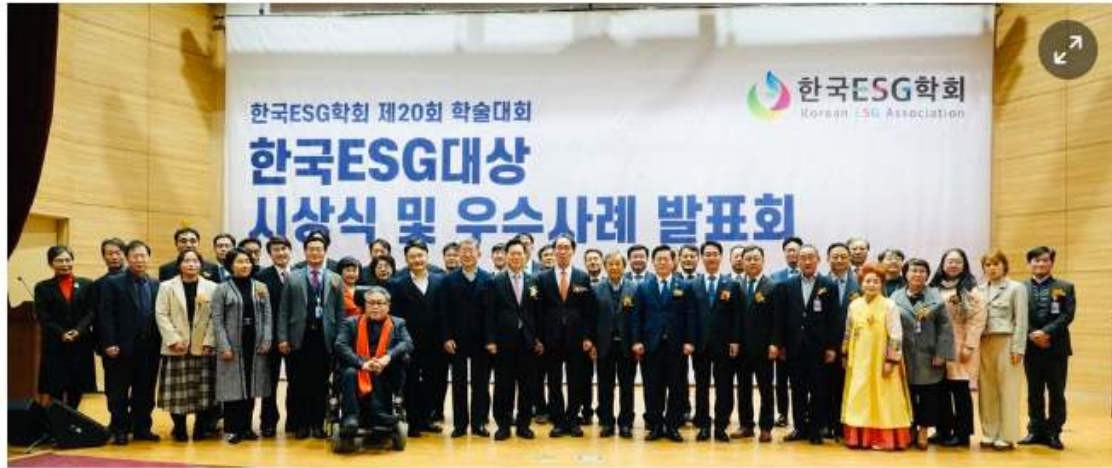
한국ESG대상 시상식 수상자들이 단체 사진을 촬영하고 있다.

공공기관·기업·단체·학교·개인 등 5개 단위 성과 발표 통해 ESG 우수사례 나뉨