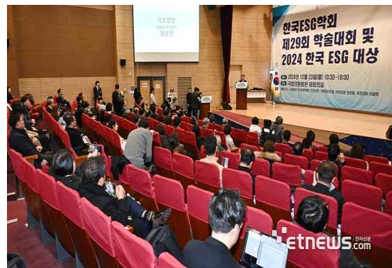
제29회 학술대회 - ESG우수사례발표