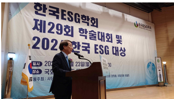
정운찬 전 국무총리 기조 강연